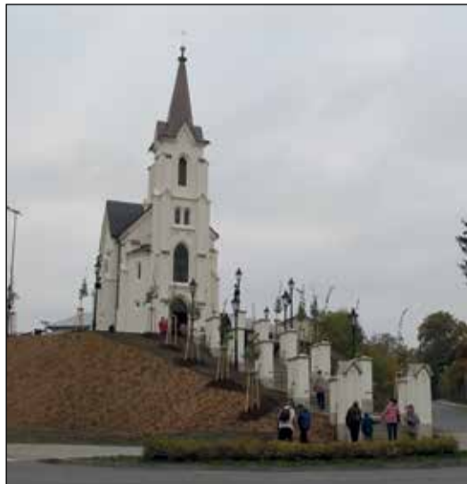
Kostel sv. Kříže neboli kaple Kalvárie bezprostředně po ukončení oprav. Slavnostní otevření se uskutečnilo v následujícím roce - tj. 2015.

V letošním roce se uskutečnila druhá etapa opravy, rozpočet této etapy představuje zhruba jeden milion korun, přičemž z Kraje Vysočina a z Ministerstva kultury ČR je přislíbená dotace ve výši 550.000 Kč. Kromě opravy krovu, krytiny a veškerých klempířských prvků bylo provedeno statické zajištění objektu, prasklý vítězný oblouk objektu byl nainstalován