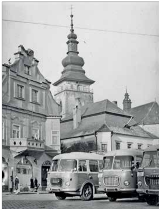
Co nám dnes přijde nemyslitelné, bylo v padesátých letech minulého století realitou. Autobusy měly zastávku na náměstí.

Primář MUDr. Pujman dovedl všechny lékaře i ostatní zaměstnance stmelit v pevný pracovní kolektiv a svým příkladem je strhával k nadšené práci. Vychoval na 50 zdatných