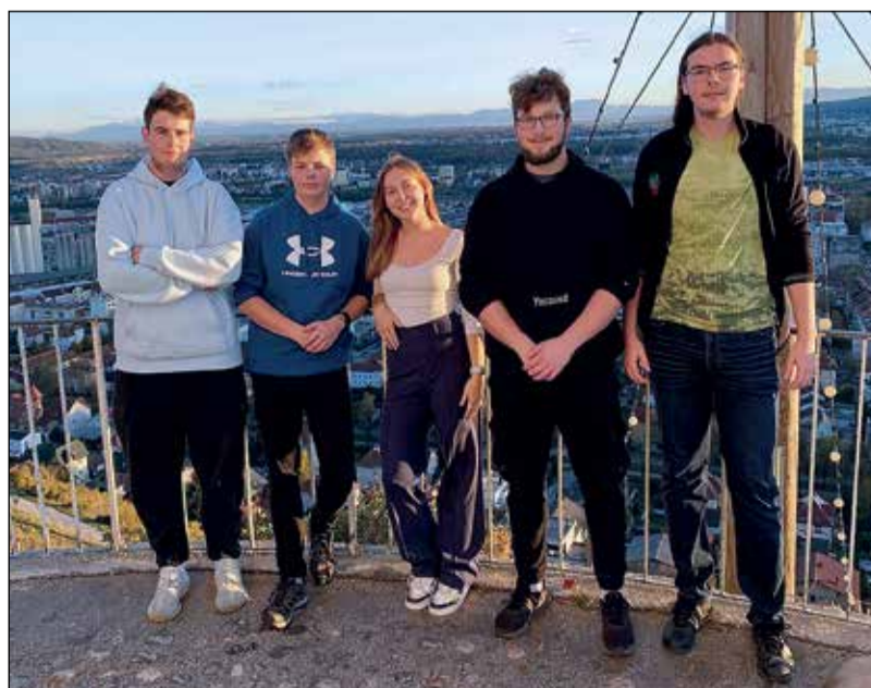
Na stáži ve slovinském Mariboru se povčil v angličtině i v programování.